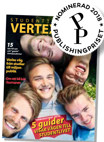
Vertex nr 4-2018.